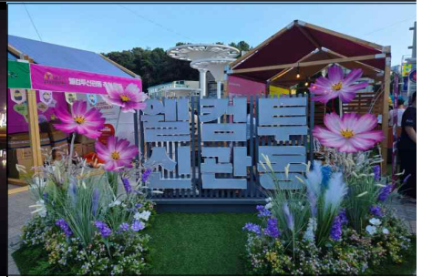
⑦ 신관동 대학로