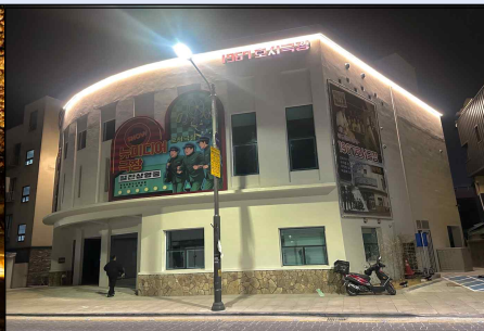
⑨ 1967 호서극장