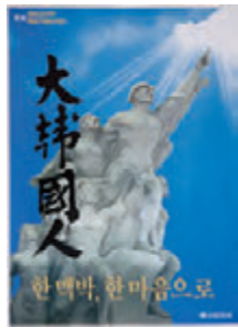
독립기념관 개관 포스터